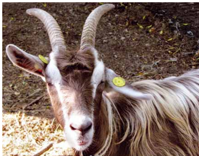
Becco di razza Orobica (a destra) e capra di razza Bionda dell'Adamello.

Ma perché il muflone asiatico e l'egagro divennero domestici, mentre numerose altre specie di erbivori, utili all'uomo e regolarmente cacciate dalle popolazioni locali quali antilopi e gazzelle, no?