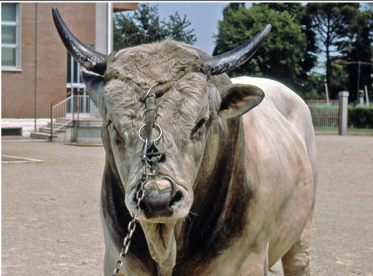
Toro di razza Romagnola, "Centro Tori" di Diegaro (FC), 1981 – Foto L. Molteni – Clicca qui